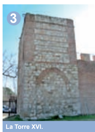
La Torre XVI.