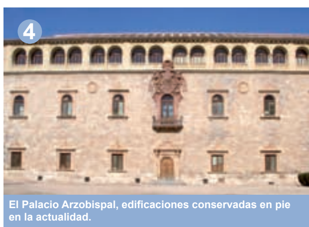
El Palacio Arzobispal, edificaciones conservadas en pie en la actualidad.