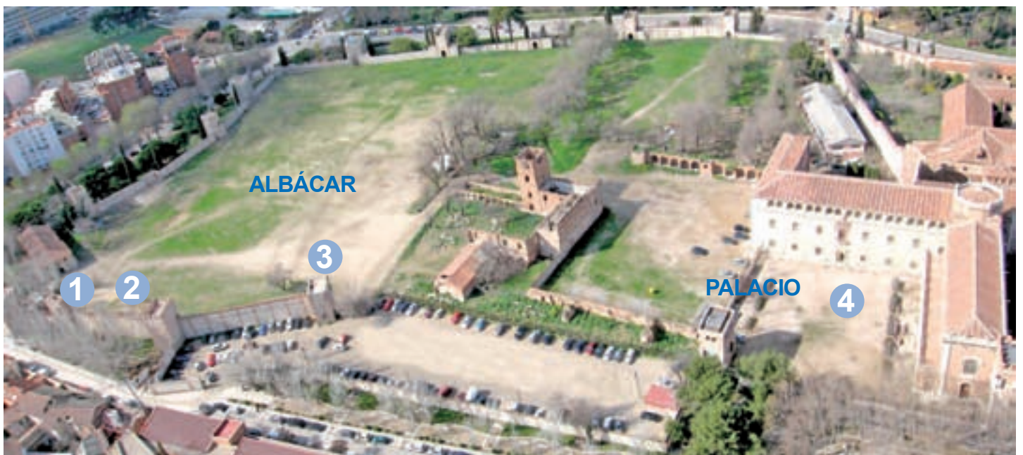
El recinto amurallado en la actualidad, indicando los espacios referidos en este folleto.