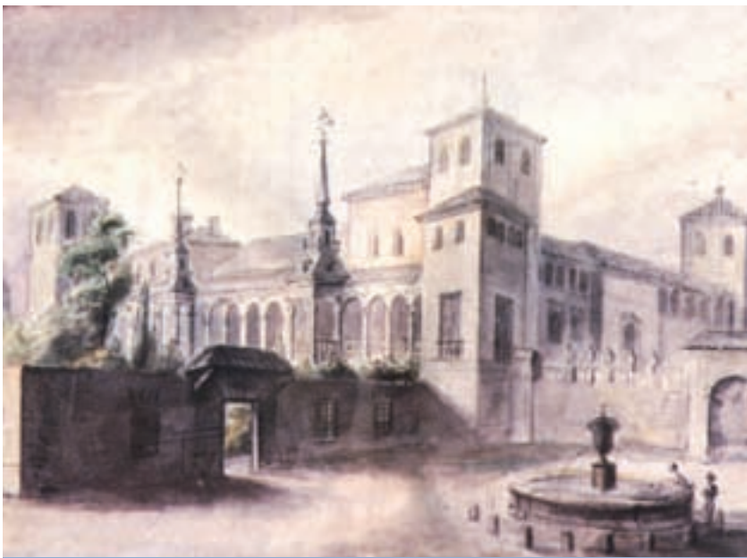
El recinto amurallado, un palacio renacentista, en un dibujo de, probablemente, finales del siglo XVIII y comienzos del siglo XIX.

Camino de ronda que permite acceder a la planta alta de las torres.