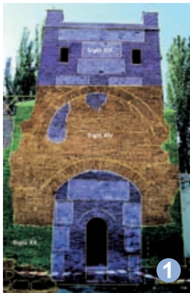
La Torre – Puerta XIV, indicando su cronoestratigrafía.

El recinto amurallado del Palacio Arzobispal se encuentra situado en el cuadrante noroccidental del casco histórico de Alcalá de Henares. Se trata de una gran superficie de unos 50.000 m 2 , donde se han acondicionado diversos espacios, ceñidos al lienzo meridional, que permiten comprender una intensa historia de más de 800 años durante los que este lugar ha sido una fortaleza medieval, un palacio renacentista, el Archivo General de la Administración y, en todo caso, un espacio simbólico de la rica historia de Alcalá.